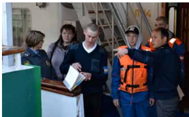
Команда готовится к встрече детей.

Дабы не лезть с расспросами в неудобный момент, когда экипаж будет занят, помогая располагаться на борту пассажирам, к речному