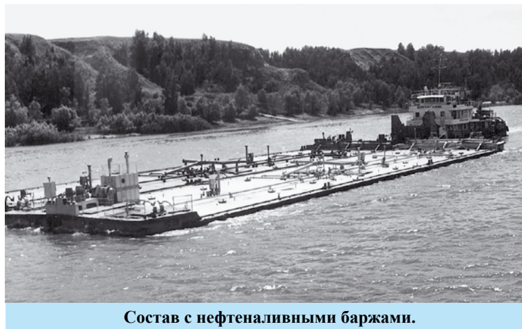
Состав с нефтеналивными баржами.

назад началось промышленное освоение нефтяных и газовых месторождений Тюменской области.