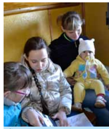
Самый маленький пассажир.