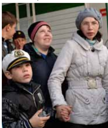
Дети смотрят на теплоход с нескрываемым восторгом.